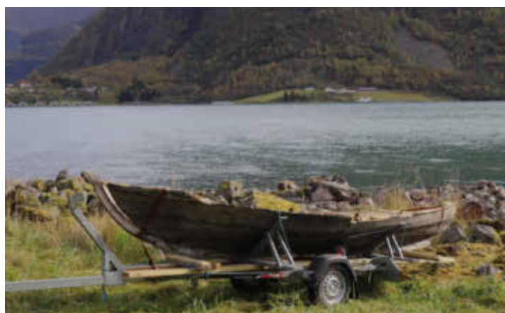
Robåten er rundt seks meter lang, har hatt to par årer.