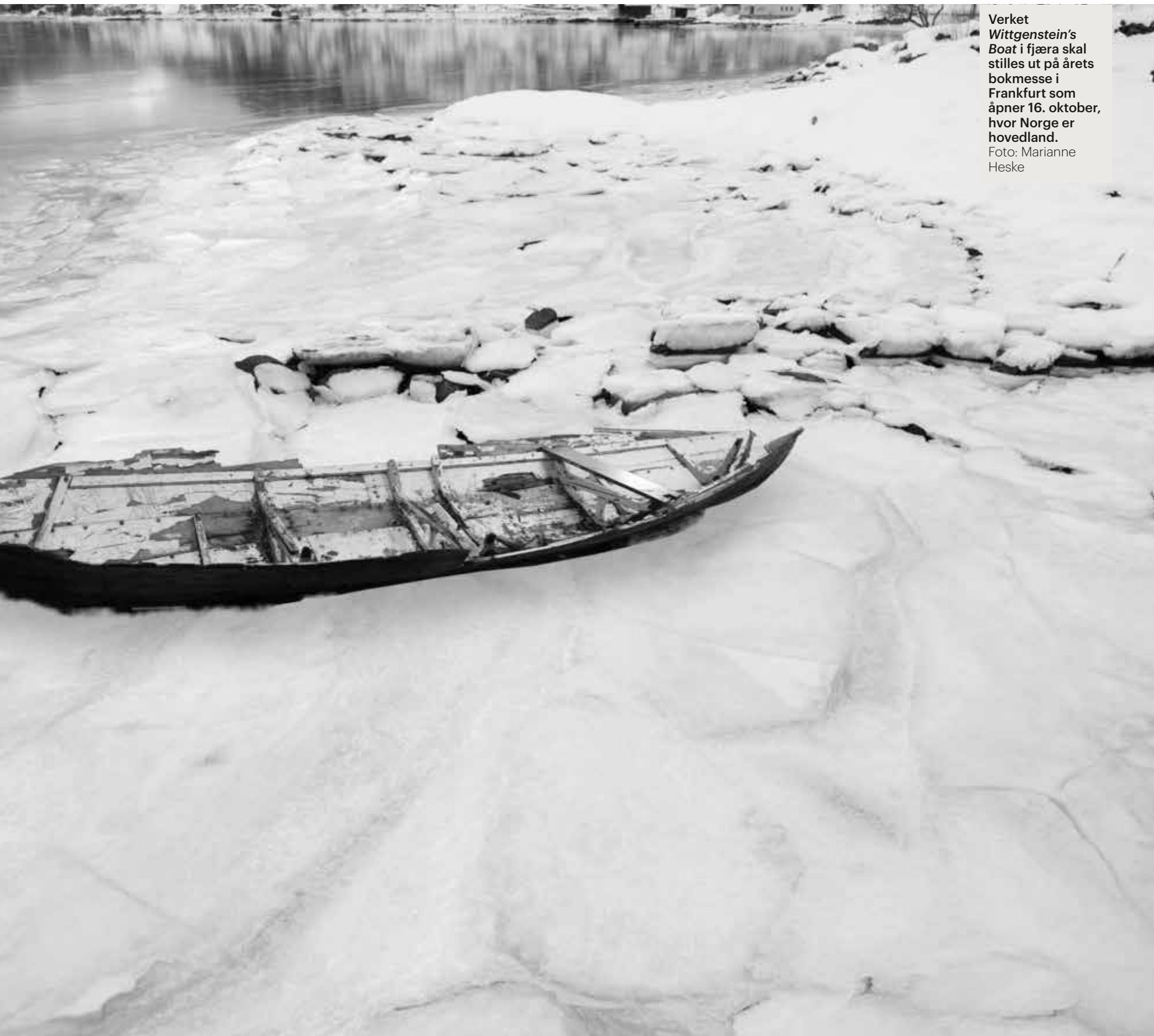
Verket Wittgenstein's Boat i fjæra skal stilles ut på årets bokmesse i Frankfurt som åpner 16. oktober, hvor Norge er hovedland.

Å preke moral er lett – å begynne moral er vanskelig