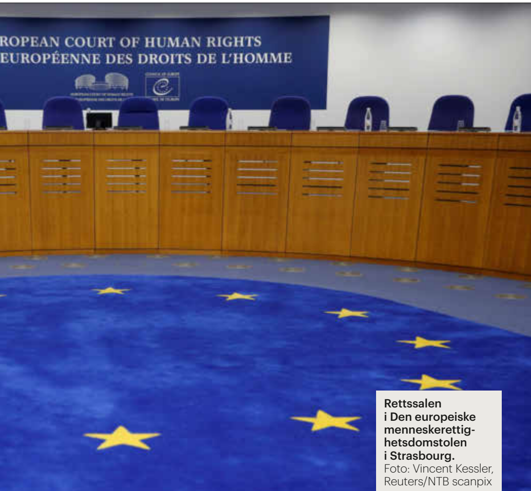
Rettssalen i Den europeiske menneskerettsdomstolen i Strasbourg.

hensynet til hva som er barnets beste i dag, som vil måtte være avgjørende, sier han.