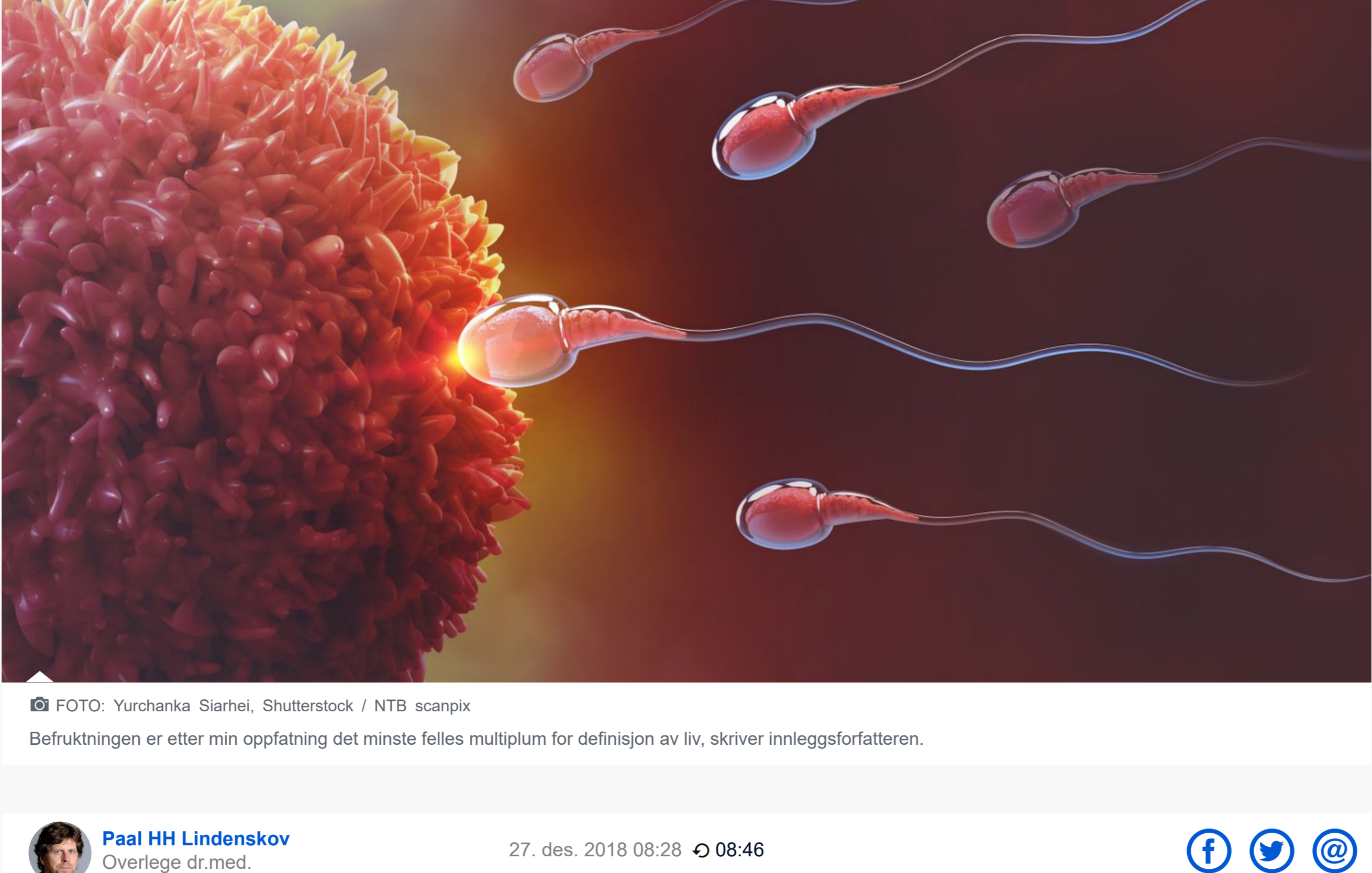
Befruktningen er etter min oppfatning det minste felles multiplum for definisjon av liv, skriver innleggsskriveren.

Paal HH Lindenskov Overlege dr.med. 27. des. 2018 08:28 08:46