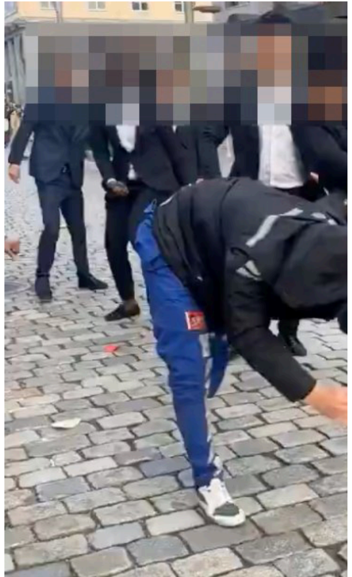
En russ ble banket opp på åpen gate i Bergen 17. mai. Fire mindreårige er mistenkt i saken.

Hvorfor ikke? Hvorfor var det ingen som bekymret seg for de frikjente mennenes rettssikkerhet? Vi skjønte jo at navngivningen ville få konsekvenser. Mennene ble utsatt for grov trakassering