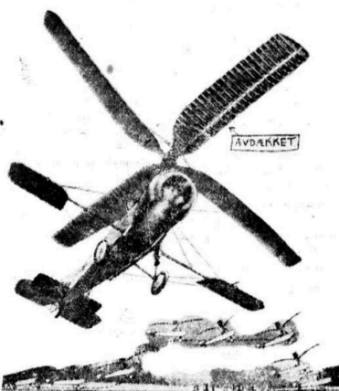
Vindmøllen i luften øverst, nederst start og flyvning.

For kort tid siden blev der ved Farnborough, det engelske flyvevæsen, eksperimenteret, i overveie av England, med fremtrædende flyvevæsen, demonstreret en ny flyvemaskin, som har faa navnet «Autogiro», og som vakte meget og ualmindelig interesse paa grund av det helt nye sytelige, brotsette denne maskin er konstruert. En flyvemaskin av vanlig type faar sin horisontalstabilitet ved propellerens trækraft. Derved spotas paa bæreløstet av lufttryk, hvis vertikale komponent, opdriften, er til maskinens vekt og holder den oppe i luften. Paa den nye type, Autogiro, eller syroplan, som den ogsaa kaldes, er bæreløstet erstattet med en slas, diagonal vindmølle i form av en stor, frehølet propeller, som roterer om en vertikal akse paa skråvinkel overkast. Forøvrig er maskinen av