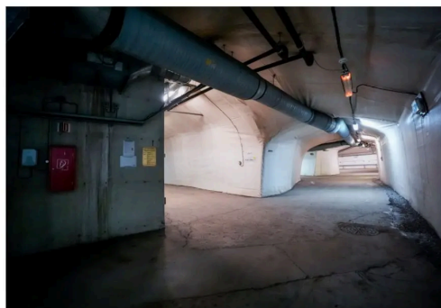
Tilfluktsrommet på St. Hanshaugen drives av Oslo kommune, som også har ansvaret for vedlikehold. Tilfluktsrommet har plass til 1130 mennesker.

til 7000 mennesker under Stortinget i Oslo sentrum.