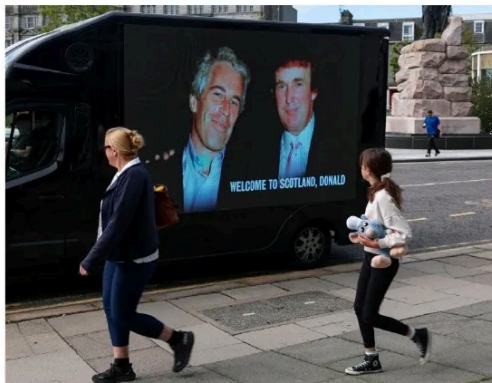
Et bilde av Jeffrey Epstein og Donald Trump var klistret ut over en varebil da Trump besøkte Aberdeen i Skottland i juli. De to kjente hverandre for 20–30 år siden.

å beskytte noen. Trump er blant dem som har spredt påstander om at Epstein kan ha blitt drept. Justisdepartementet og FBI sa i juli at det ikke finnes bevis for at det finnes noen «klientliste». De slo fast at Epsteins død var selvmord.