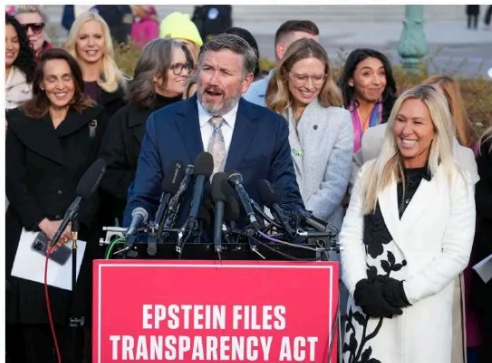
Republikaneren Thomas Massie har presset på for å få frigjort Epstein-filene. Epstein-saken har bidratt til at Marjorie Taylor Greene (til høyre) er kommet på kant med Donald Trump.