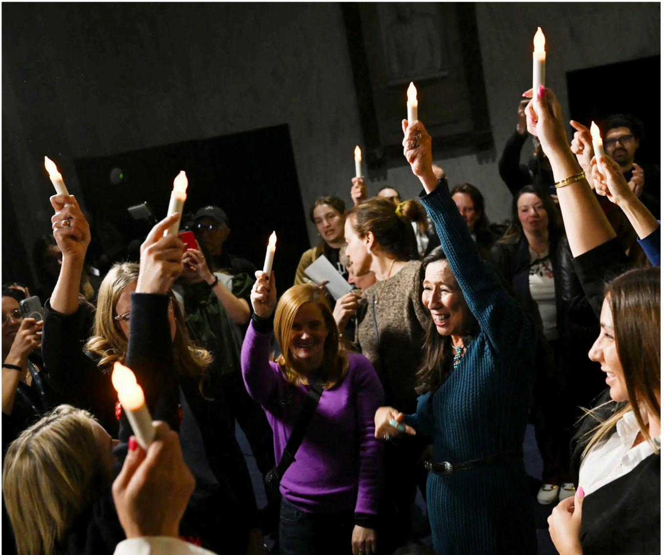
Gledesutbrudd blant ofre og involverte i Washington da det tirsdag kveld ble kjent at Epstein-dokumentene vil bli frigitt.