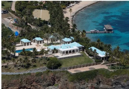
Jeffrey Epstein eide øya Little St. James i Karibia. Donald Trump sier han ikke har vært på øya.