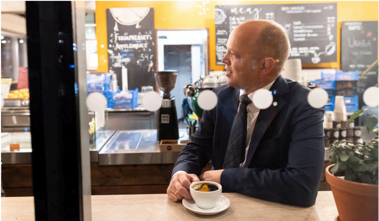
◉ Som Senterparti-leder satset Trygve Slagsvold Vedum på kaffekoppstrategien før valget i 2021. Her drikker han kaffe i rollen som finansminister.