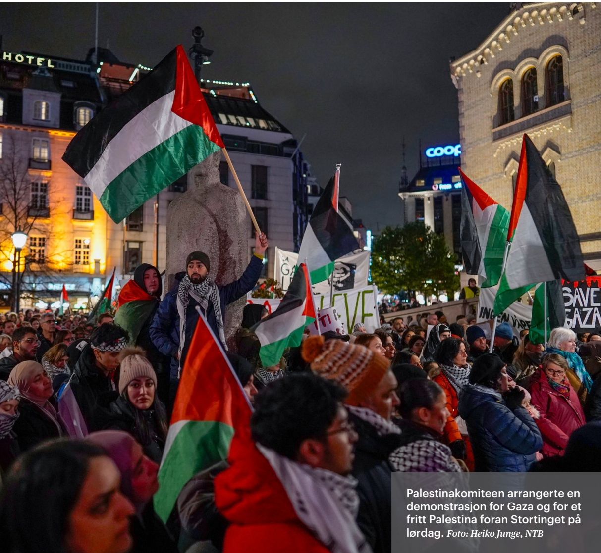
Palestinakomiteen arrangerte en demonstrasjon for Gaza og for et fritt Palestina foran Stortinget på lørdag.