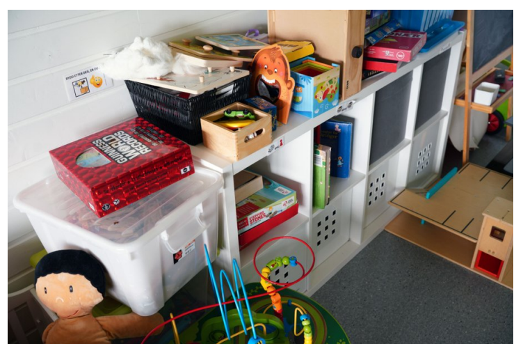
→ I Løkkeveien i Vikersund kommune har det lokale barnevernet et hus som blir brukt blant annet til å huse barn kortvarig.

sove sammen med dem der. Det oppleves veldig uforutsigbart når Bufetat ikke kan bistå oss.