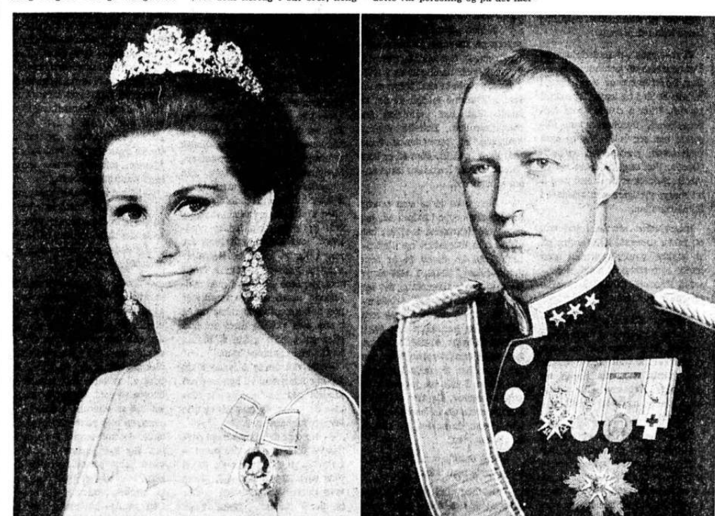
Arveprinsens mor og far — kronprinsesse Sonja og Kronprins Harald.

tet som det nasjonale kongedømme og ble alltid stående i dets skygge. Navnlige søkte og fant bondene hos kongen beskyttelse og vern mot de mektiges forsøk på å undertrykke dem. Dette gjelder ikke minst de siste konger av Haarfragre-ætt, Erik II og Haakon V Magnussoner.