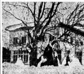
Skaugum i vinterskrud, fotografert like efter at den lille arveprins var født — Skaugum flagget igår.

Kongen meddelte selv i telefonen statsminister Nygaardsvold den gledelige begivenhet. Statsministeren gratulerte og forberedte straks statsrådets innkallelse til