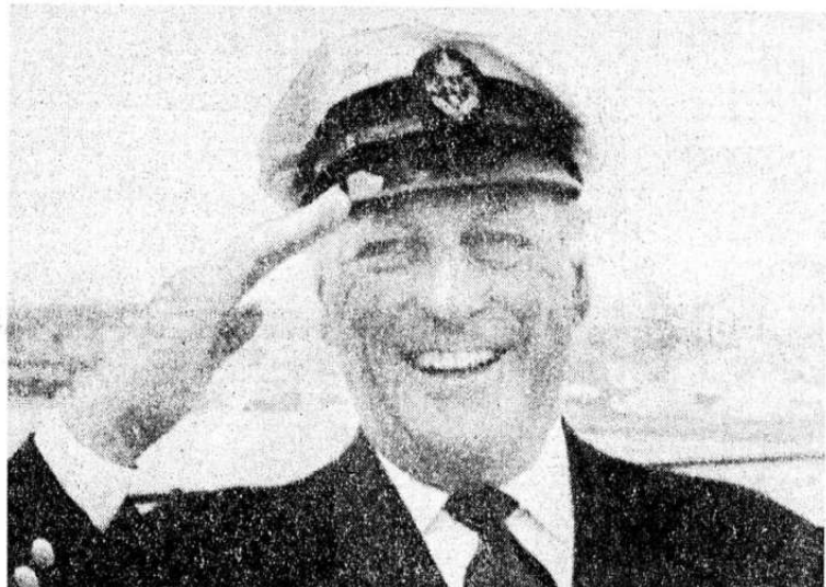
Ombord i kongeskipet Norge, i havnen i Lysekil, mottar kong Olav gledestrålende meddelelsen om at kronprinsesse Sonja har født en prins.

Fra en spesiell medarbeider. Lysekil, 20. juli.