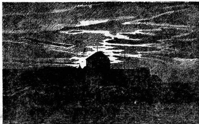
Kristiansten. Efter tegning av S. Segeleke.