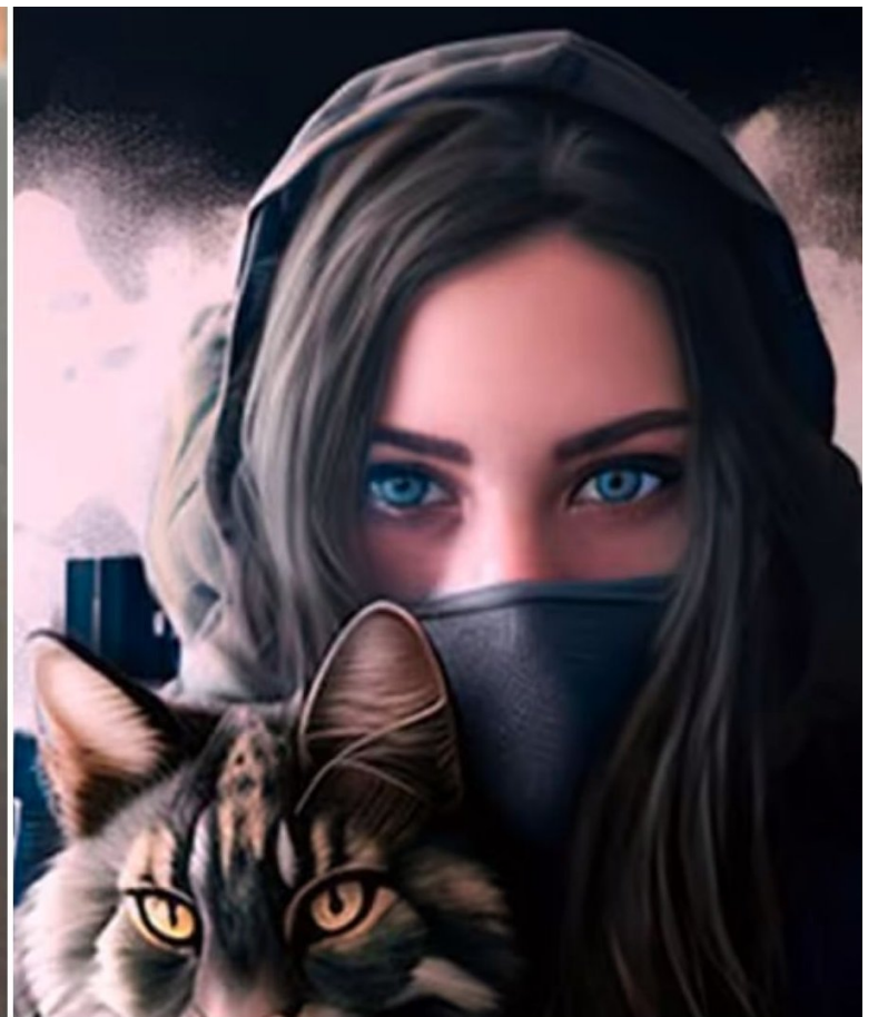
«Jenta fra Donbas» er nå identifisert som en 37 år gammel kvinne fra USA.

«Jenta» har mange navn og opererer på flere plattformer: