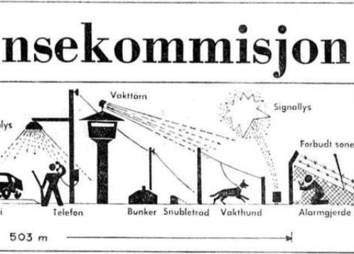
Skisse av de mange innretninger på øst-tysk side av grense n. Alt tar sikte på å hindre flukt over til Vest-Tyskland. (Originaltegning: Time Magazine.)

i Haag. Et angivelig brudd på denne avtale utgjør en viktig del av Vest-Tysklands klage til domstolen. I Forbundsrepublikken har man meget liten forståelse for Islands argument om at utvidelsen av fiskerigrensen fra tolv til femti nautiske mil 1. september 1972 var nødvendig for å beskytte islandske nasjonal-økonomiske interesser og hindre rovdrift på fiskebestanden på feltene utenfor Island. Sterke presgrupper i de havnebyer og delstater hvor den havglænde vest-tyske fiskeriflote hører hjemme, er meget aktive overfor forbundsmyndighetene i Bonn i denne saken.