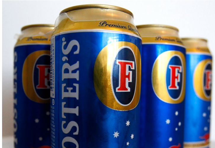
• Foster's er et populært øl i Australia, men i noen deler av landet får ikke urinnvånerne kjøpe det.

I løpet av fjoråret ble det meldt om 2653 voldshendelser i Alice Springs. Det er mye i en by med 25.000 innbyggere, melder BBC. En femtedel av innbyggerne er urinnvånere.