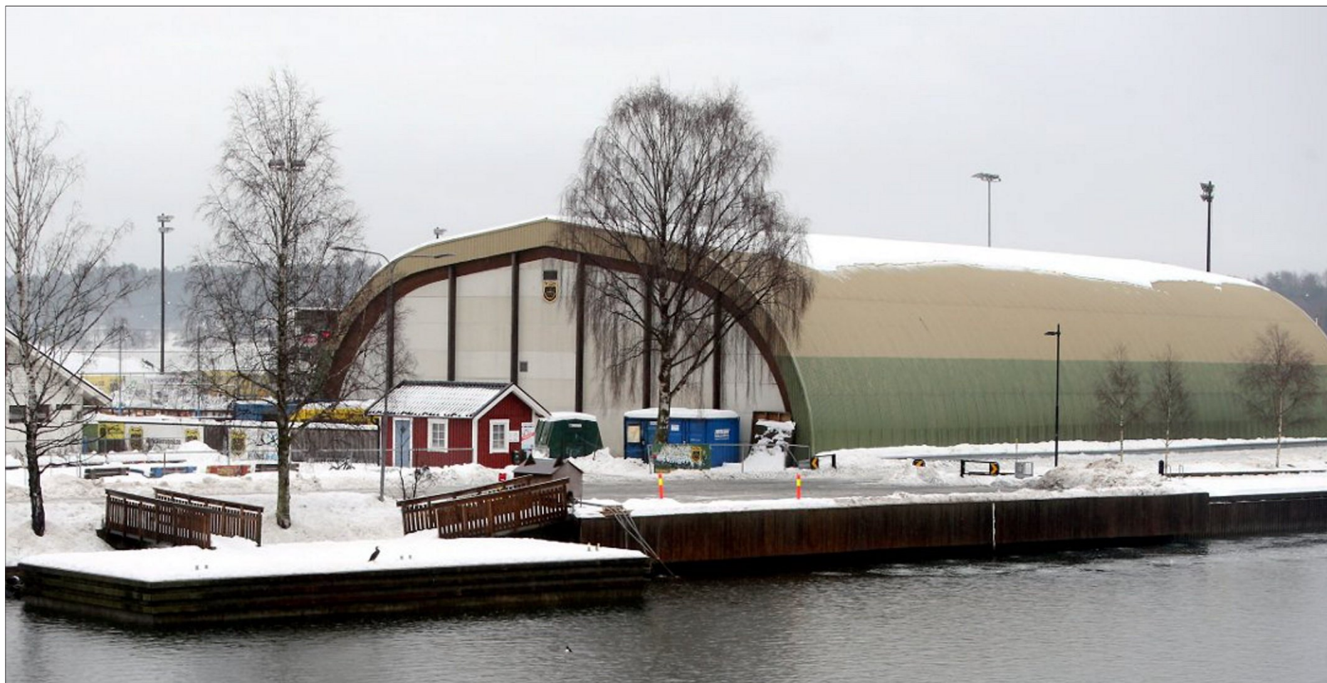
Hallen på Kadettangen omtales av mange som Sandvikas styggeste bygg. Kommunen skal ha betalt 2 millioner kroner i kompensasjon til Bærum Sportsklubb for at hallen skulle rives i 1992. Men over 30 år etter, står hallen fortsatt.