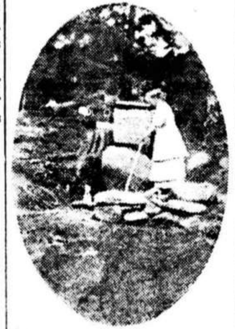
Et glas af den lækende drik.

fjeldene fra Voss til Valdres for at kristne valdrisen. Da han kom farende over Bagn, havde bønderne samlet sig i skogaasen langt