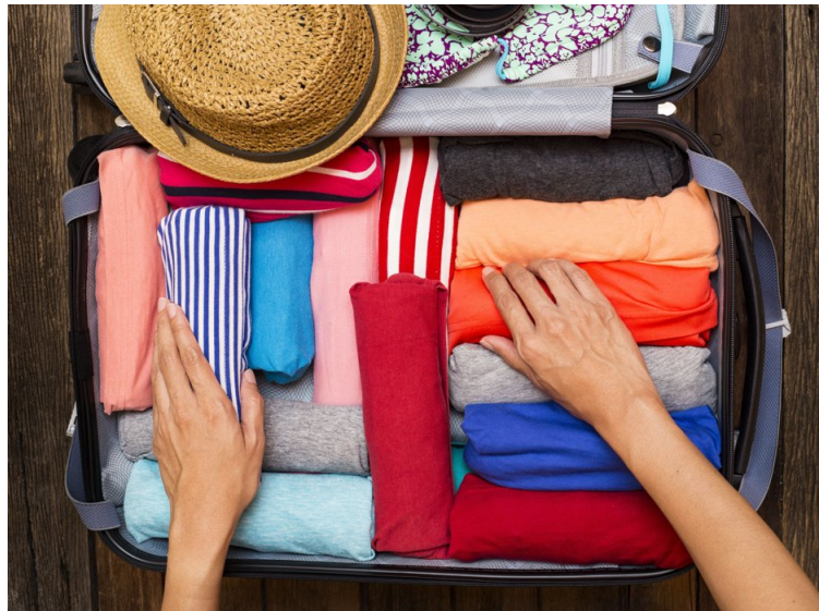
Rull klærne dine når du pakker, og legg dem tett. Det er oversiktlig og plassbesparende.