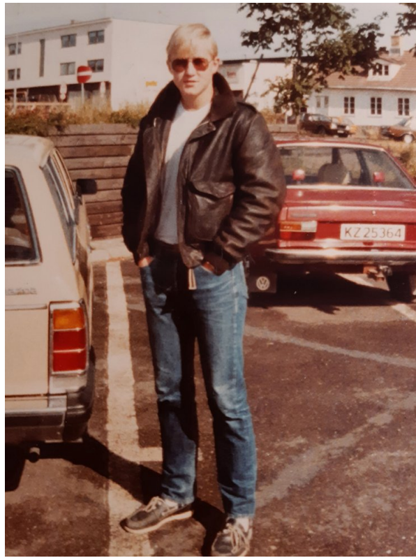
1983. På vei til skolegang i Frankrike.