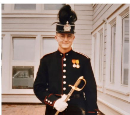
1989. Ferdig på Krigsskolen Gimlemoen.