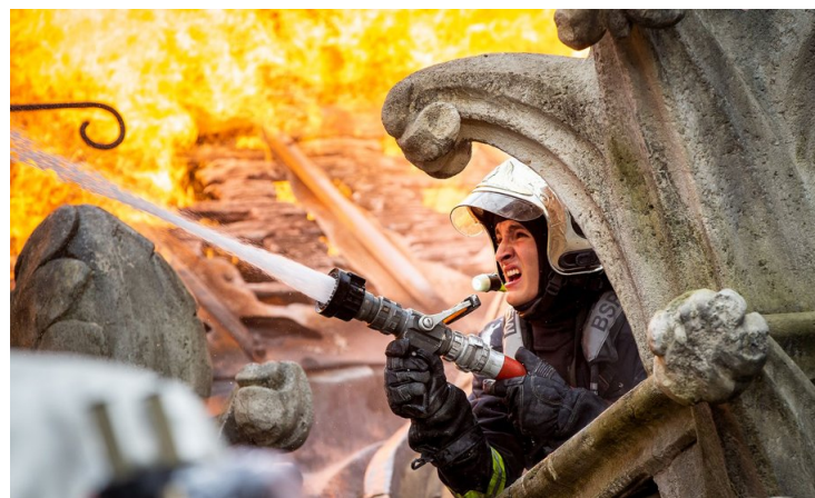
Brannfolk kjempet en desperat kamp mot flammene i Notre-Dame.