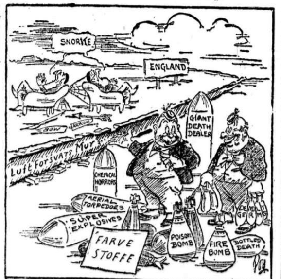
Englekk karikatur, som viser faren for et luftangreb fra Tyskland.

Byerne vil blive indhyllet i giftige gasskyer. Marechal Foch om kemiens strategi.