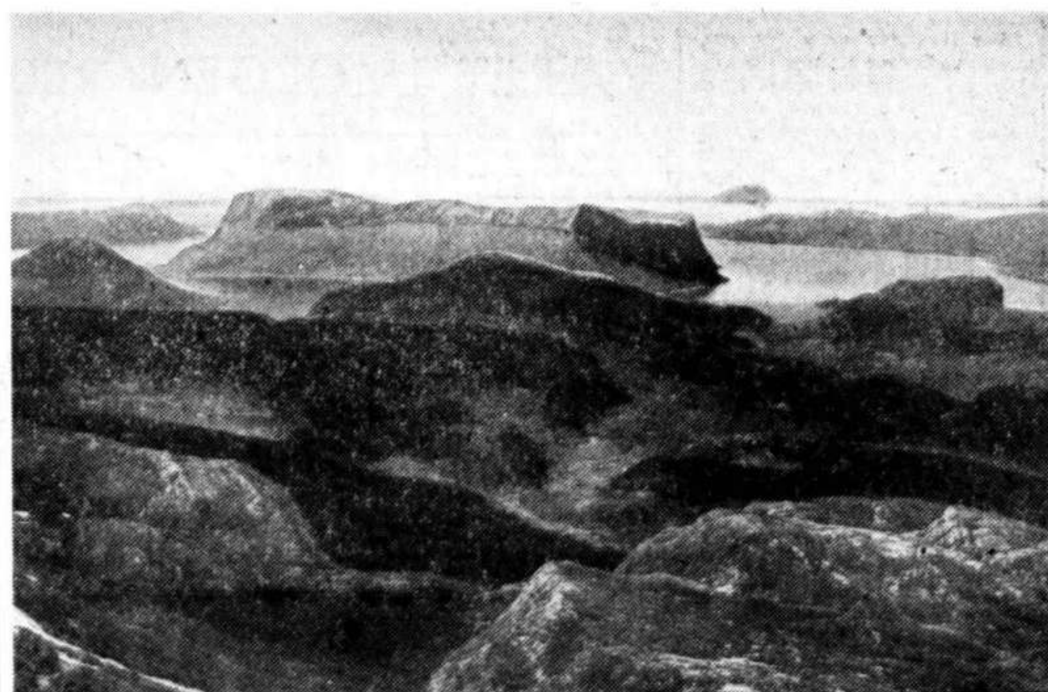
Fjelllet Lihesten, hvor «Havørn»-ulykken fant sted.

Hadde avsporingen skjedd ca. 50 meter lenger nord, vilde en katastrofe av stort omfang ikke ha været til å undgå. Bare et kort stykke fra avsporingen går banelinjen på en fylling, og en avsporing her vilde ha medført at vognene vilde ha veltet ut over skråningen og ned i dypet nedenunder.