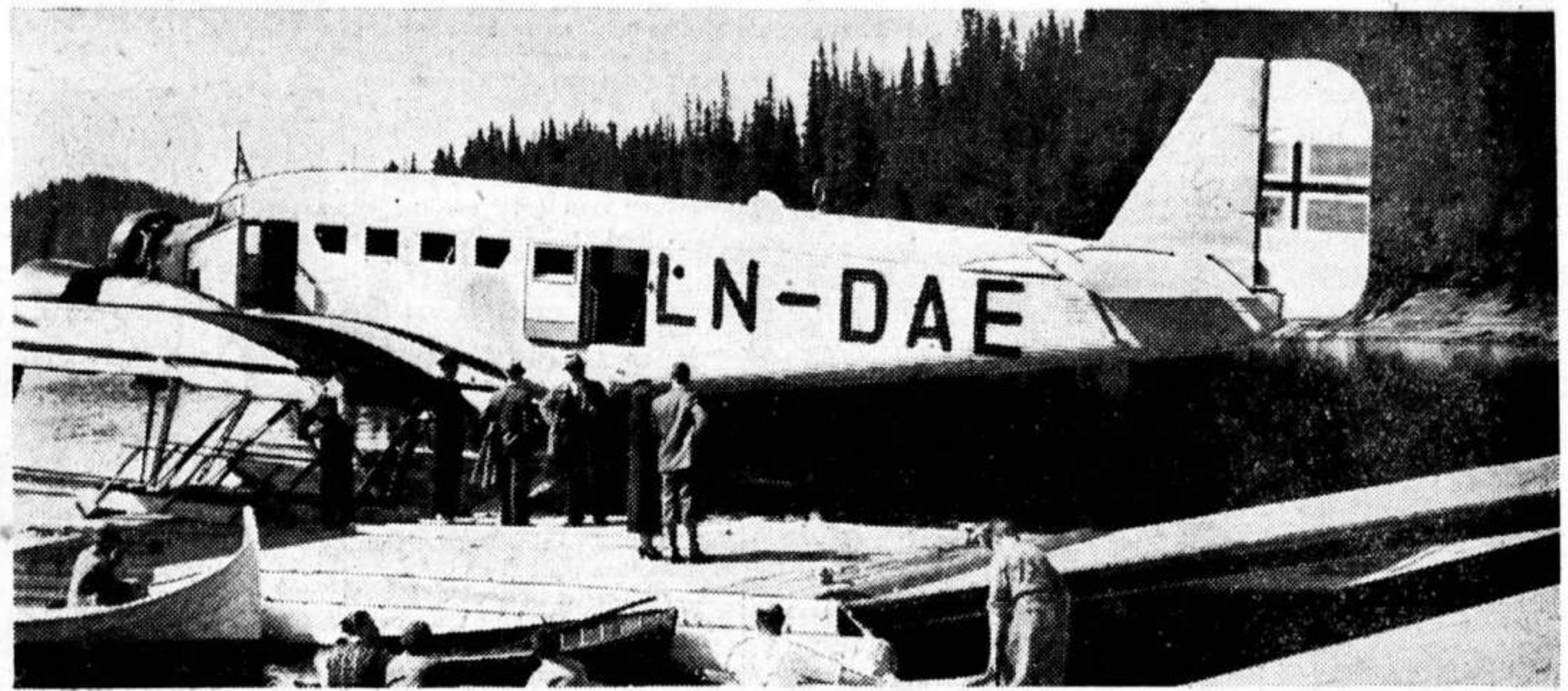
«Havørn» på Jonsvann ved Trondheim, fotografert igår ettermiddag av Aftenpostens flyvemedarbeider, som brukte flyet på dets næst siste reise.

Styrtet ned på øen Lihesten ved Sognefjordens munning. De 7 ombordværende drept. Vanskelig redningsarbeide i vild fjellur og 500 meters høide.