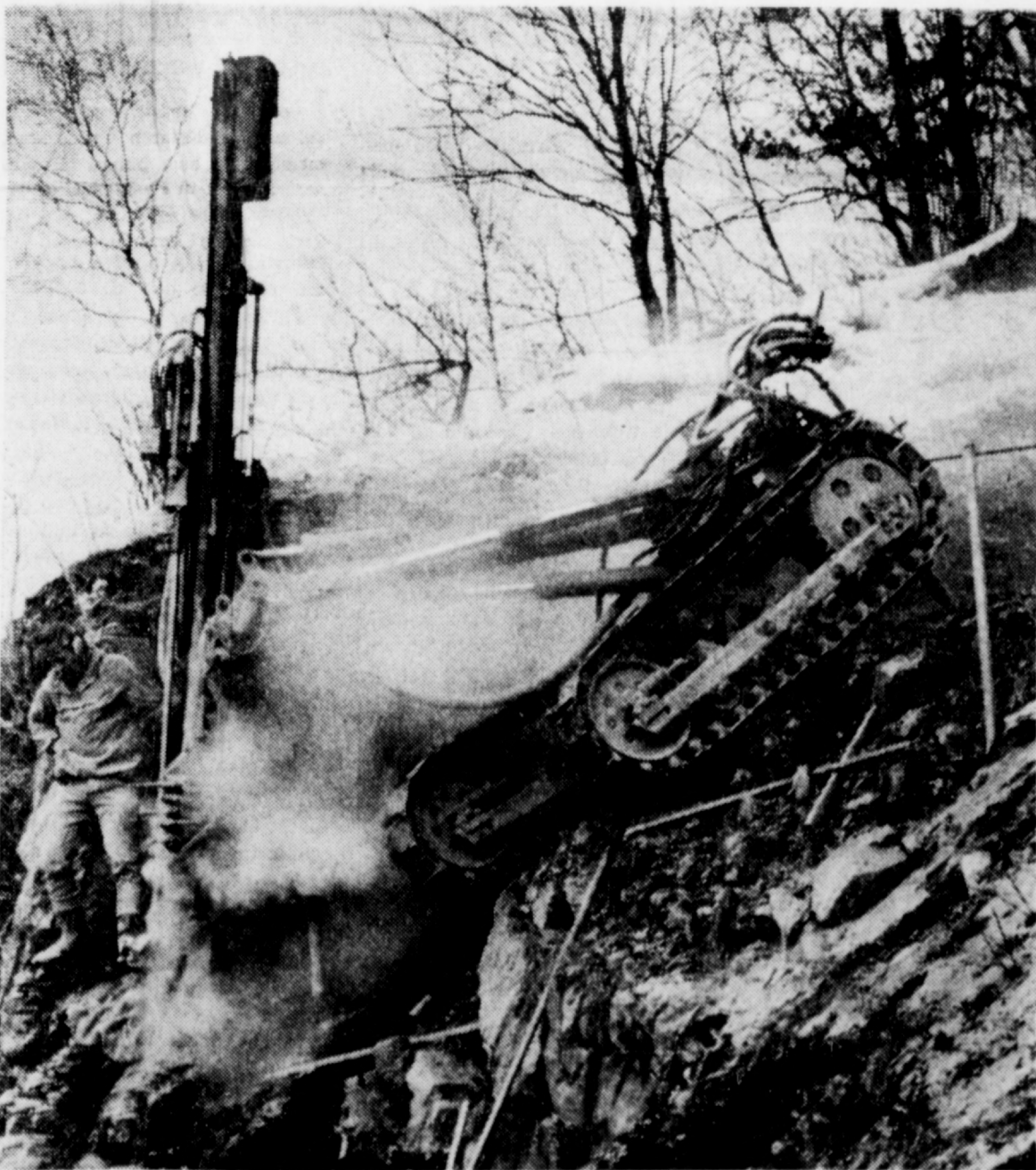
Fjellet må gi tapt for moderne fjellboringstutstyr og sprengstoff. Denne borjiggen er i ferd med å «spise» seg ned i fjellet høyt oppe i Høegtoppen. Det går ikke lange tiden mellom hver sprengning, og mange kubikkmeter stein sprenges løs med hver salve. En tøff jobb for tøffe karer.

Man må gjøre regning med at anleggs- og byggearbeider vil sette sitt preg på Sandvika i lang tid fremover. Så får man håpe at den forvandling Sandvika sentrum for tiden er inne i, blir en forvandling til det bedre . . . .