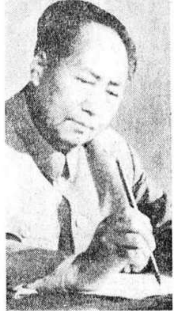
på Maos uttalelser og bevegelser ved hjelp av mikrofoner av samme størrelse som

I over 10 år hadde russerne hemmelige mikrofoner skjult både på kontorer og hjemme hos formann Mao Tse-tung. Det er en av de mange rodegardistavisene som hevder dette.