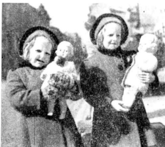
Familie som evakuerte imorges fotografert på Østbanen.

Talt skulde 70-80.000 mennesker ha forlatt byen idag. På Østbanestasjonen begynte folk å samle sig da det lysnet imorges, og ved 9-tiden var adskillig tusen mennesker samlet under kuppeltaket. Ingen panikk, ingen forvirring. Alle tok det rolig. Der satt oldinger i rullestol og gamle bestemødre med skaut rundt hodet og bylter under armen. De brukte kofferten til stol. Der var mødre med 14 dager gamle spebarn i babyposer. Ingen gråt, ingen klaget. Bare de litt større gjemte sig bak morens skjorter, og etpar unge mødre spurte nervøst om konduktøren trodde flyene vilde bruke maskingevær, hvis de begav sig ut på stasjons-