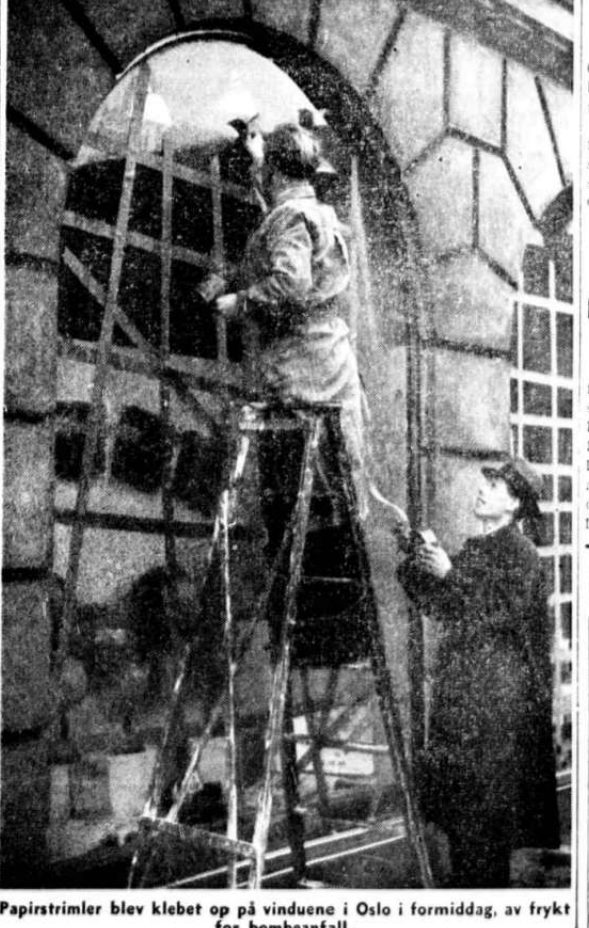
Papirstrimler blev klebet op på vinduene i Oslo i formiddag, av frykt for bombeangrep.

Brev til Aftenposten. Manuskripter som skal innstas i Aftenposten, eller andre henvendelser til bladets redaksjon, må ikke adresseres til bladets medarbeidere personlig, men til Aftenpostens redaksjon. Man vil ellers risikere at slike brev blir liggende uopnået hvis vedkommende medarbeider er bortreist.