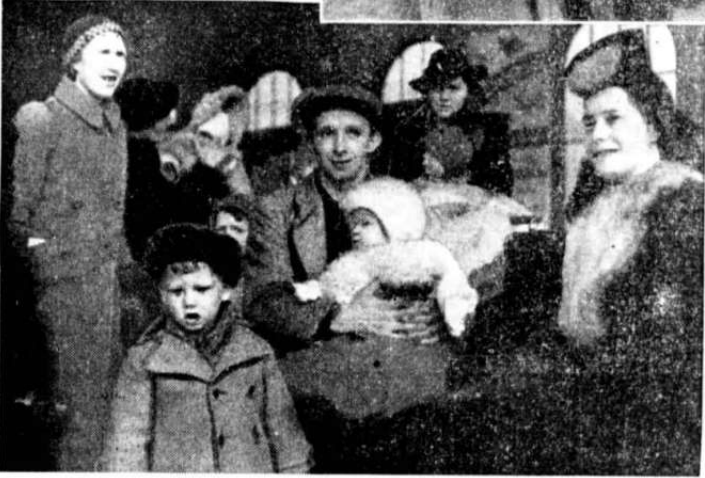
området. De vernet spebarna med armene så godt de kunde.

Tyske tropper gikk over den danske grense ved Flensborg og Tønder idagmorges.