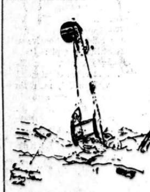
Dette billede forestiller

Enkelte af »Flagermusen«s medarbeidere forsøger ogsaa at være smaa-morsomme. Det lykkes ogsaa tildels. Medarbejderen holder sig da ogsaa pent nede paa jorden. Her et par forsøg: Efter forlydende blev en kjendt Kristianiafrue negtet optagelse i vegetarforeningen forleden, da hun var — kalvbent. Samtidig berettes, at en mand med lidet hode og store ben begav sig til frelsesarmeen for at blive — omvendt.