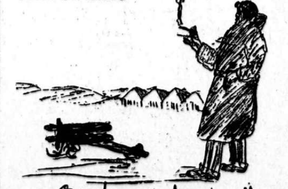
Efter den første flugt. — (Manden ogsagen stiger — manden i selvgælske — søgen i høiden).

Enkelte af »Flagermusen«s medarbeidere forsøger ogsaa at være smaa-morsomme. Det lykkes ogsaa tildels. Medarbejderen holder sig da ogsaa pent nede paa jorden. Her et par forsøg: Efter forlydende blev en kjendt Kristianiafrue negtet optagelse i vegetarforeningen forleden, da hun var — kalvbent. Samtidig berettes, at en mand med lidet hode og store ben begav sig til frelsesarmeen for at blive — omvendt.