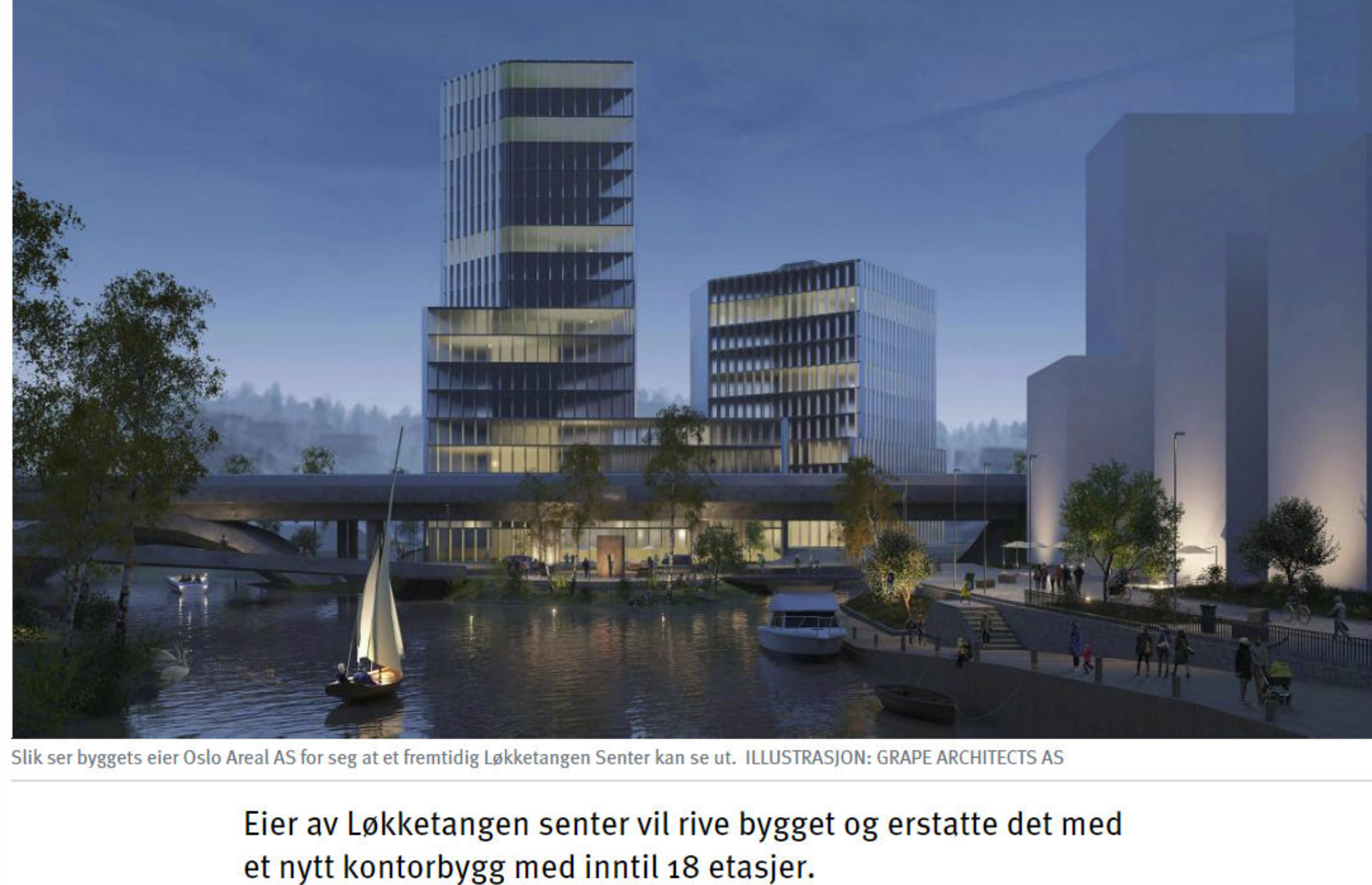
Slik ser byggets eier Oslo Areal AS for seg at et fremtidig Løkketangen Senter kan se ut. ILLUSTRASJON: GRAPE ARCHITECTS AS

Eier av Løkketangen senter vil rive bygget og erstatte det med et nytt kontorbygg med inntil 18 etasjer.