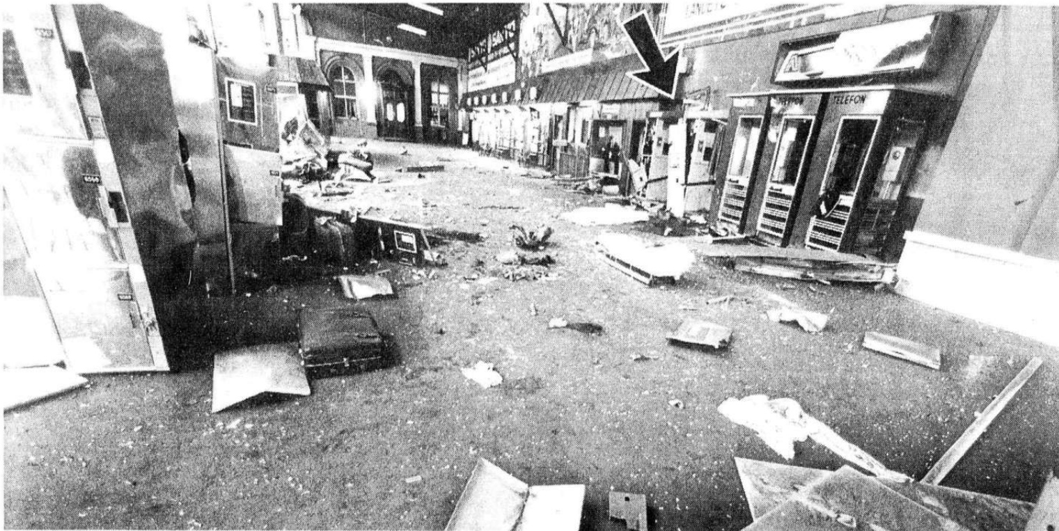
Kvinnen som ble drept oppholdt seg inne i en av fotoautomatene i ventehallen (pilen på bildet) da bomben eksploderte.

essert i alle opplysninger publikum måtte sitte inne med. I løpet av kvelden igår ble en rekke personer avhørt som vitner.