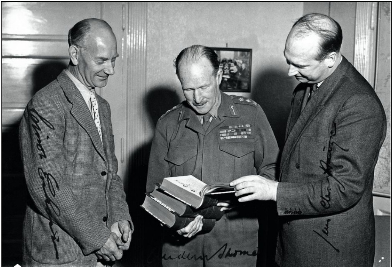
Statsminister Einar Gerhardsen, tidligere sjef for de allierte styrkene i Norge, general Andrew Thorne, og forsvarsminister Jens Christian Hauge studerer trebindsverket Norges krig 1940–45 i 1951. Det var Jens Christian Hauge som på vegne av Hjemmefronten natt til 8. mai fremforhandlet avtalen om at de tyske styrkene skulle legge ned våpnene.