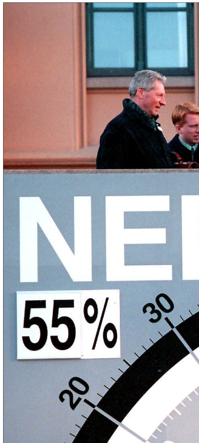
EU-AVSTEMMING: Norge stemte nei til EU i 1972 og 1994. Her fra 1994, der et

Ingen internasjonal avtale er perfekt, heller ikke EØS-avtalen. Den har svakheter og mangler, som alle andre avtaler. Etter mer enn et kvart århundre kan det være grunn til å se på mulige forbedringer. Det ligger oseaner av forskjeller mellom å prøve å forbedre en avtale, ikke minst praktiseringen av den, og å bryte over tvert. EØS har gitt norsk næringsliv og