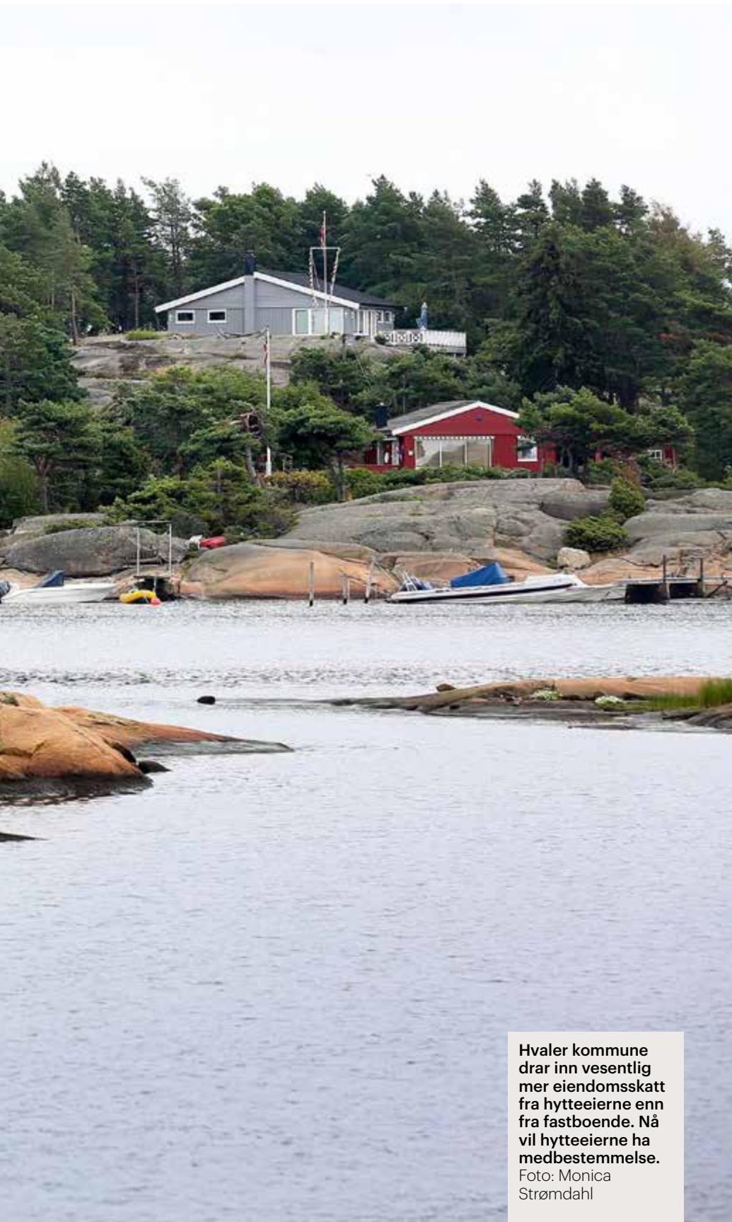
Hvaler kommune drar inn vesentlig mer eiendomsskatt fra hytteeierne enn fra fastboende. Nå vil hytteeierne ha medbestemmelse.