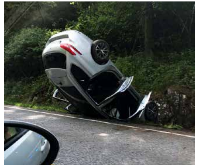
En utforkjøring ved Siljan i Telemark medførte tre skadede personer i går ettermiddag.

- Jeg skjønner engasjementet fra eiere av fritidsboliger når det gjelder byutvikling og reguleringer, men det er kanskje vanskelig at de skal få uforholdsmessig stor innflytelse på utdannings-, omsorgs- og tjenestetilbudet til de fastboende. Alltid spennende å tenke nytt, sier Harberg.