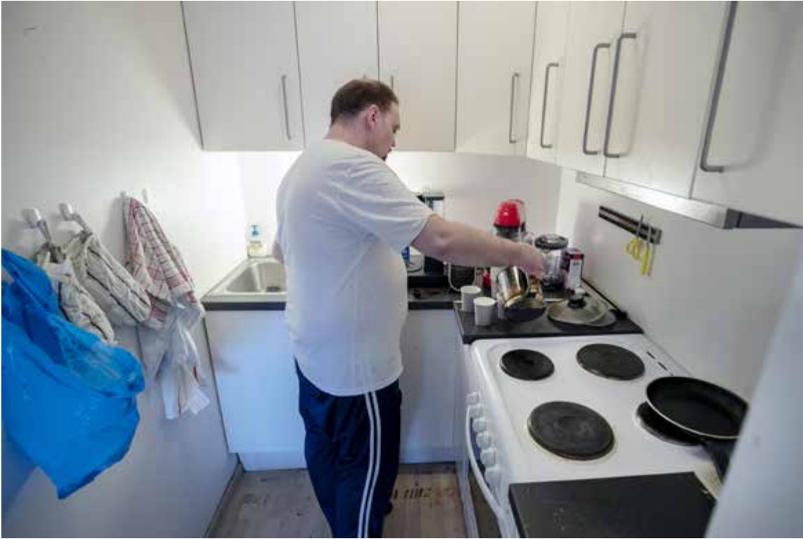
Å ha et eget hjem med ansvar for alt, er en enorm overgang for en som har flyttet mellom hospitser. I oppveksten var han så mye alene at han måtte lære seg å lage mat. Det kommer godt med nå.