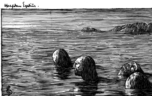
Seidmennene på Skrattaskjær, Ill. Halfdan Egedius, Heimskringla

Men da de kom like opp til garden på Avaldsnes, ble det lys dag. Da gikk det helt annerledes enn Øyvind hadde tenkt; det mørket, som han hadde fått laget med trolldommen, kom over ham sjøl og kameratene hans, slik at de så ikke mer med øynene enn med nakken, og gikk bare rundt i ring hele tida. Vaktmennene til kongen så dem, de kunne ikke skjønne hva dette var for slags folk. Det ble sagt fra til kongen, og han og følget hans stod opp og kledde på seg. Da kongen fikk se Øyvind og folkene hans gå der, sa han til mennene sine at de skulle ta våpen og gå bort og finne ut hva dette var for folk. Kongsmennene kjente igjen Øyvind, og så tok de ham til fange, ham og alle de andre, og leidde dem til kongen. Så måtte Øyvind fortelle hvordan alt hadde gått for ham. Etterpå lot kongen ta alle sammen og sette dem ut på et skjær som sjøen gikk over i flotid, og lot dem binde der. Slik mistet Øyvind og alle disse folkene livet. Siden heter skjæret Skratteskjær