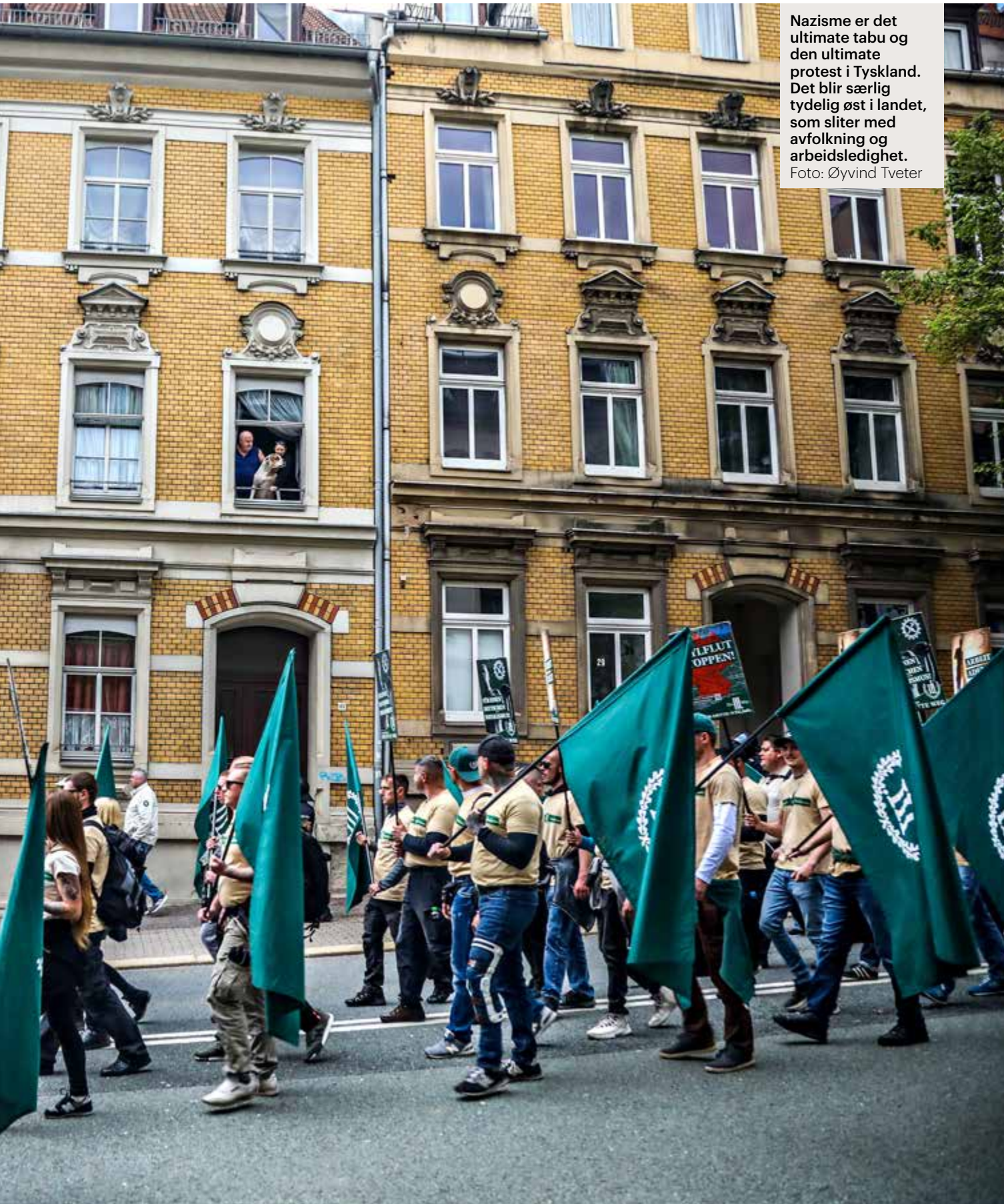
Nazisme er det ultimate tabu og den ultimate protest i Tyskland. Det blir særlig tydelig øst i landet, som sliter med avfolkning og arbeidsledighet.

Tröglitz. Mottaket ble satt fyr på. Det er ikke bare Tyskland som opplever en økning i rapporteringen av hatkriminalitet: Antallet som melder ifra, har doblet seg det siste tiåret i EU.