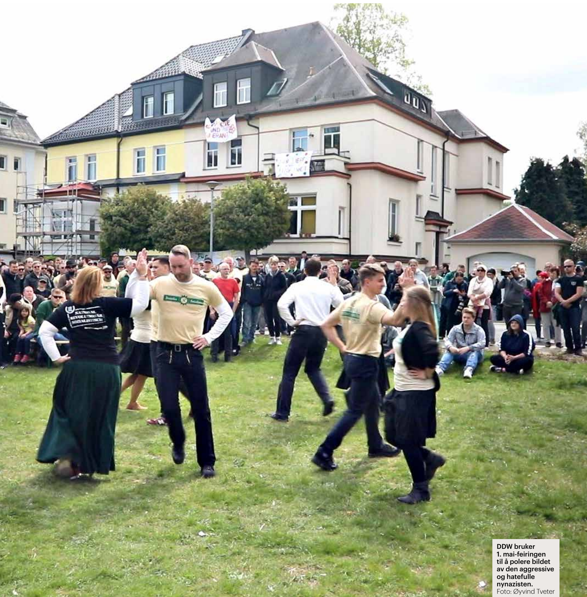
DDW bruker 1. mai-feiringen til å polere bildet av den aggressive og hatefulle nynazisten.

Han smiler. Gentsch høres og ser ut som han vet at han holder seg «på rett side» ved å ta avstand fra nazisme og vold. Samtidig definerer partiet hans hvem som er tyskere, basert på blodsbånd bakover i generasjoner.