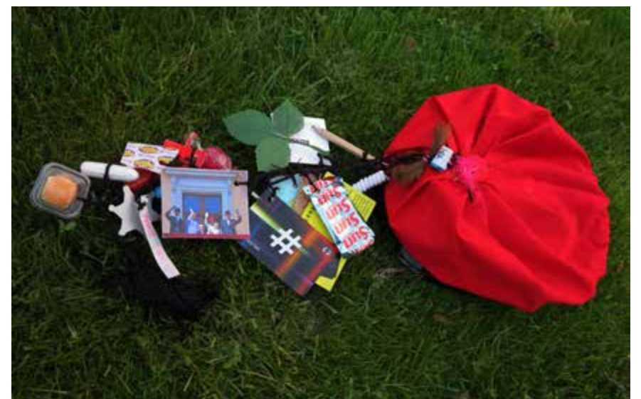
Det finnes, tradisjonen tro, vågale russeknuter blant de hundre vi har laget. Ti av dem handler om sikker sex i år. Nitti gjør ikke, skriver innleggsfaterne.

Sett også lys på alt det bra rusen gjør! Alt det fine vi feirer i russetiden. Alt samholdet vi har og får. Så skal vi gjøre det vi kan for å få en inkluderende, trygg og god russetid - selv med litt vågale russeknuter.