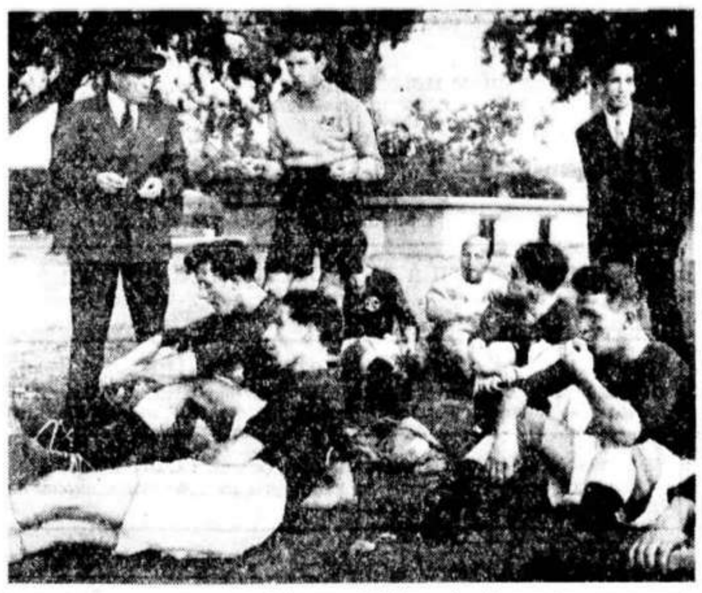
Guttena tilbringer pausen i landskampen i Cairo under de rare træerne som guttene kalte egyptiske juletrær. Her er de i ferd med å sette tillitsløse noen forfremmede appelsiner.

EN INNBRODDSTIV som har vært straffet mange ganger tidligere, kom ut av fengsel etter å ha sonet sin siste dom.