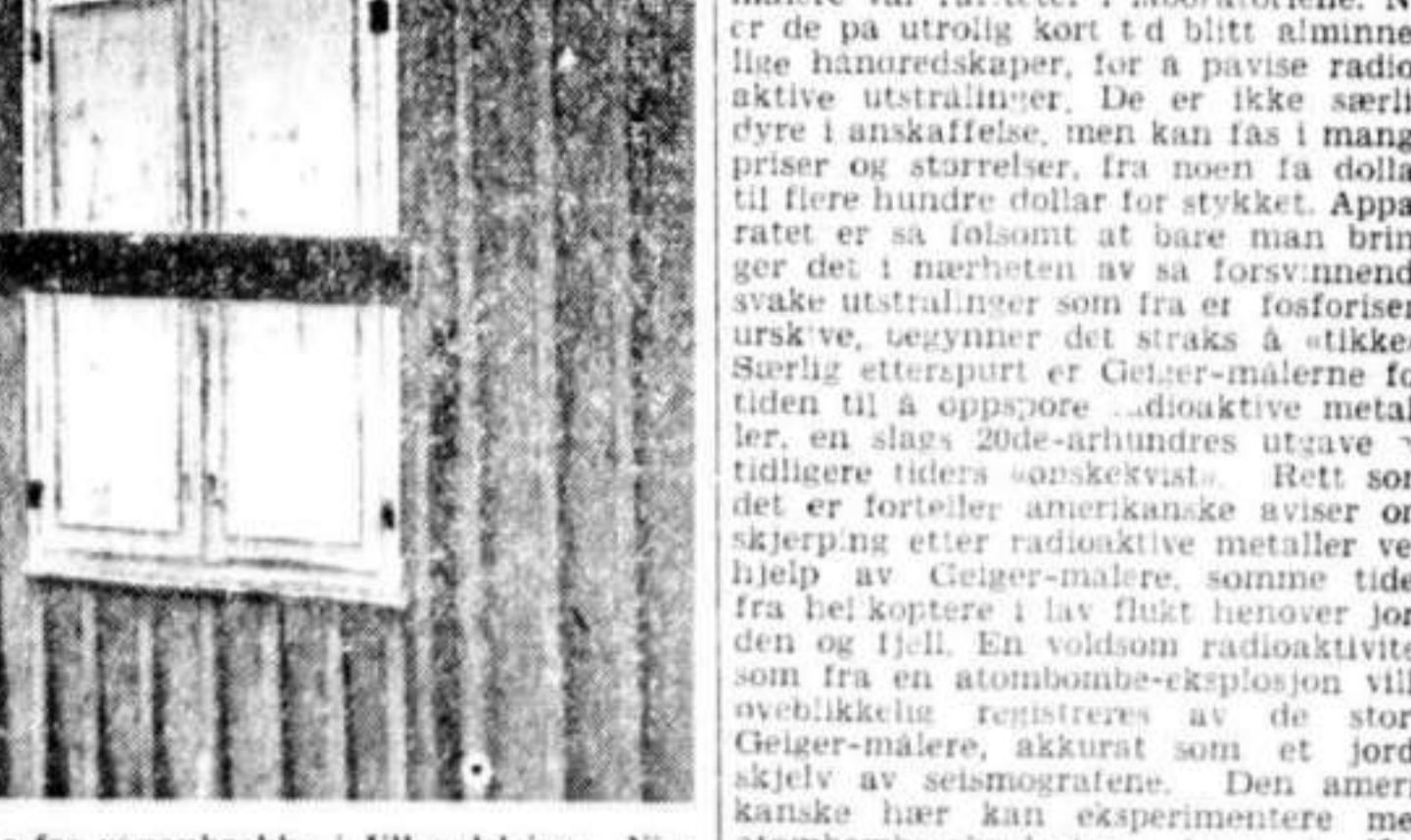
Aftenpostens fotograf tok i går dette bilde fra vaperbrakka i Ullevålsleiren. Vinduene har trelemmer med jernstenger midt over vinduene. Jernstengene er forsynet med en bolt i den ene enden. Det var denne tvynen flette over i vinduet til høyre. Deretter slo de inn vinduet og kunne så gå inn.