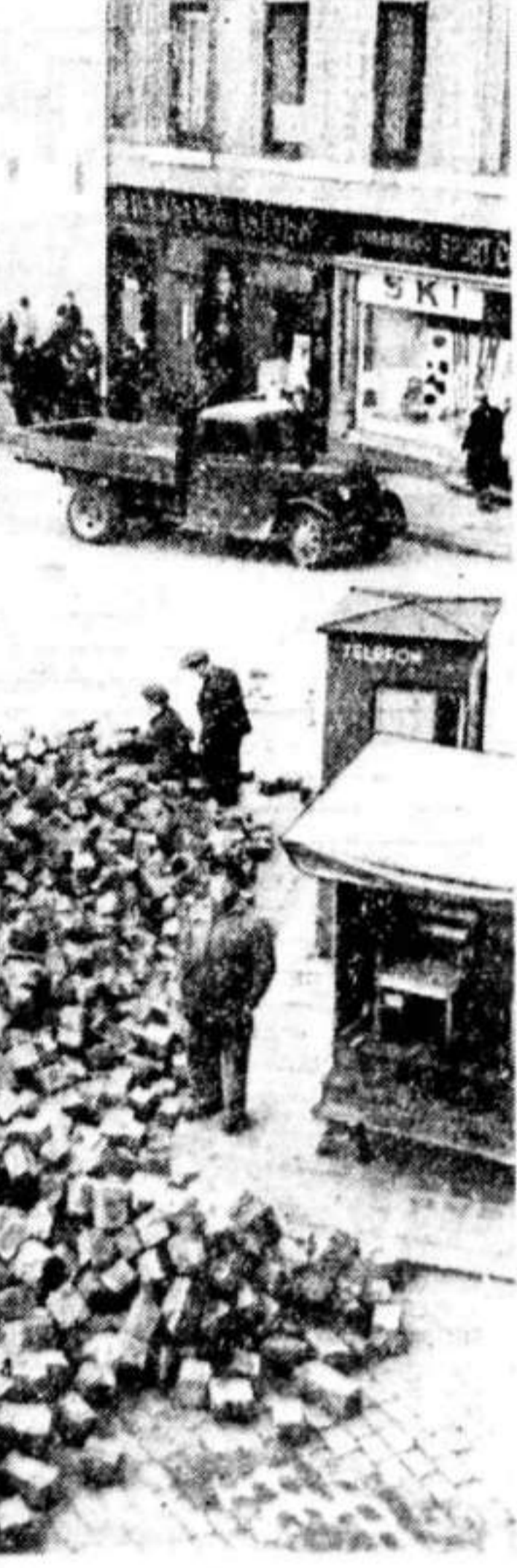
Situasjonen på Karl Johan i formiddag.

All kraft blir satt inn for å få Karl Johans gate i stand igjen, sier veisjef Ottosen i en samtale med Aftenposten i formiddag. Man samler sammen så mange mann som kan plasseres og det arbeides også på overtid. Kanskje i løpet av et par dager skulle gaten kunne være i brukbar stand igjen. Men bruddet på vannledningen har anrettet store ødelegelser, da det varte nok så lenge før vannet ble stengt av. Det blir en temmelig kostbar reparasjon. Vi forelegger veisjefen et forslag, som en ingeniør har lansert — om å benytte anledningen til å legge betongdekke mellom Egertorget og Stortingsbakken. Tidligere er det lagt slutt dekke fra Grand til Slottsbakken. Det skal være bevilget penger til betongdekke på Egertorget til Kirkegata. Ved å legge betongdekke over bruddstedet vil pengene spares, mener innsenderen. — Tanken er god, svarer veisjef Ottosen, men det er et viktig moment som spiller inn. Som kjent skal Undergrunnsbanen forlenges på nettopp her og det er planer om en stasjon på Egertorget. Derfor vil det være uheldig å fortsette videre med betongdekke, og vi vesenest vil av den grunn konsentrere seg om å reparere underlaget og legge på småbrustein. Ikke bare for bruddstedet, men helt ned til Kirkegata. Det er skuffende som har trøret på vannledningen? — Ja. Det er jo meget alen i fjellet og ved utsvingene i den blitt brukt til gatene. Tidligere var man ikke klar over dens farlighet.