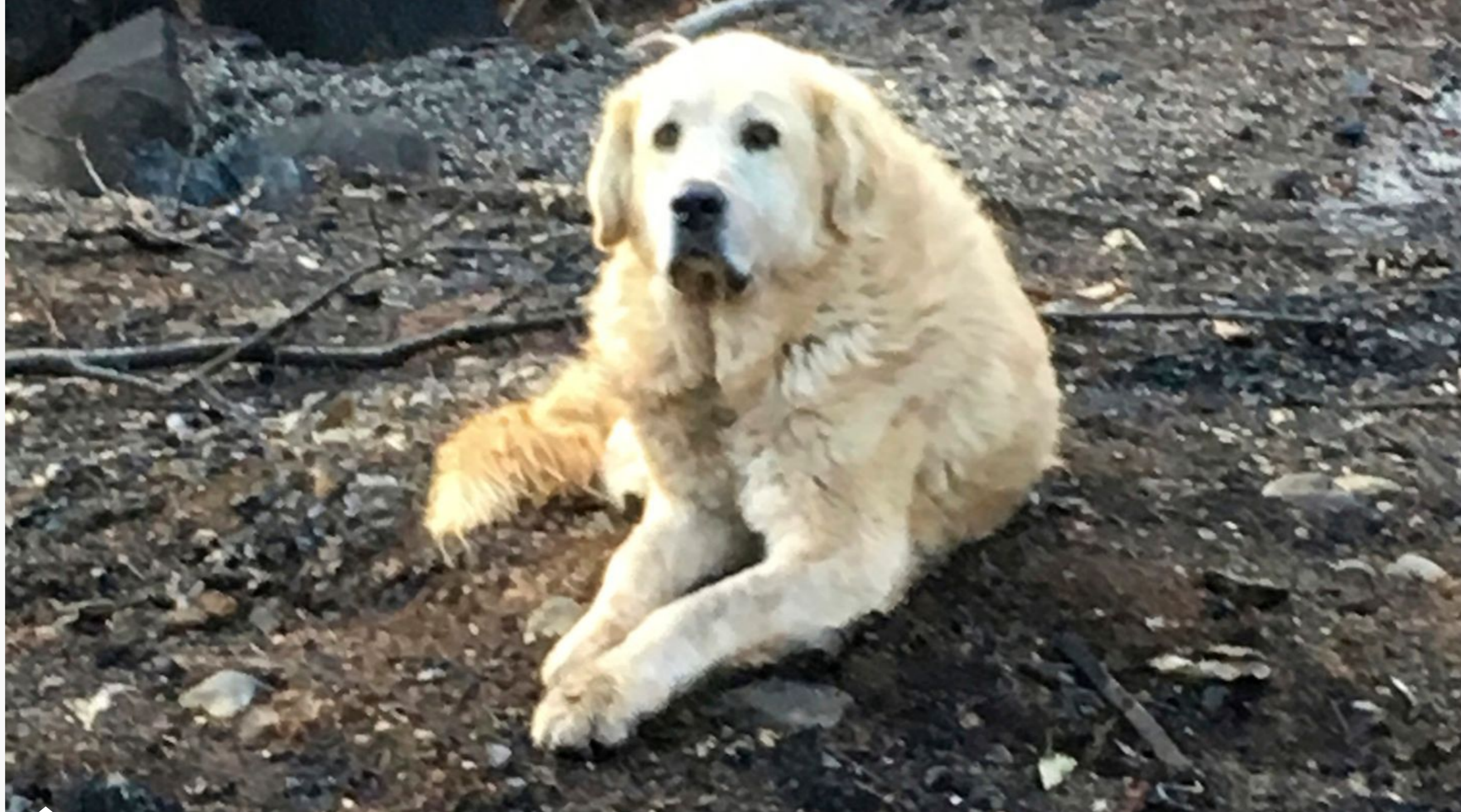
Den anatolske gjeterhunden Madison overlevde skogbrannen i Paradise.

Mye tyder på at vakhunden Madison passet eierens hjem mens skogbrannen herjet.