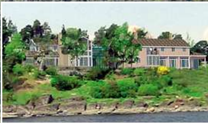
I FJØR: Slik så Røkkes forrige forslag ut. Den moderne fasaden var preget av glass.