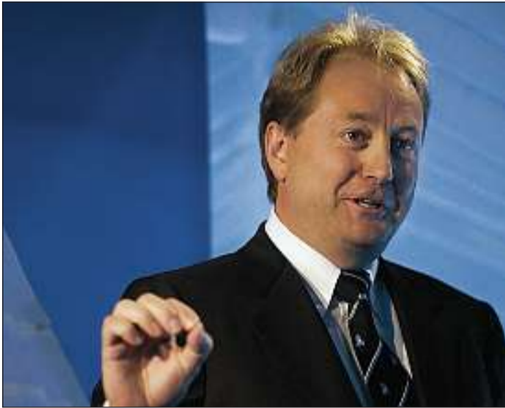
SØKER: Kjell Inge Røkke.