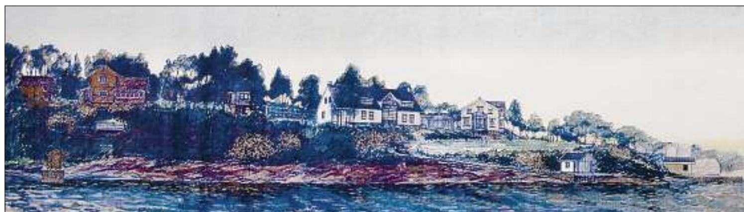
SOMMERSTEMNING: «Juninatt Konglungen» har arkitekten kalt denne illustrasjonen.

– Den manglende oppfølging er etter rettens mening et så grovt brudd på god meglerskikk, at den er erstatningspliktig, konkluderer dommen fra tingretten. Nå blir det altså en ny runde om saken i lagmannsretten.