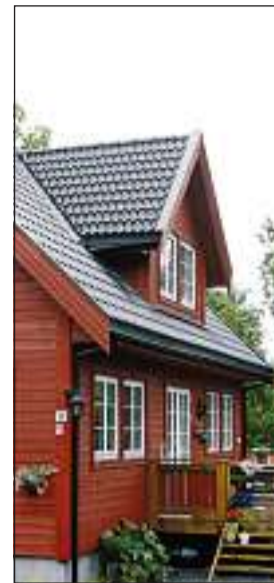
KAN BLI REVET: Eierne av dette huset i Mobakken på Jar fikk ikke vite at huset de kjøpte kan bli revet for å gi plass til ny tilførselsvei til ny E18.