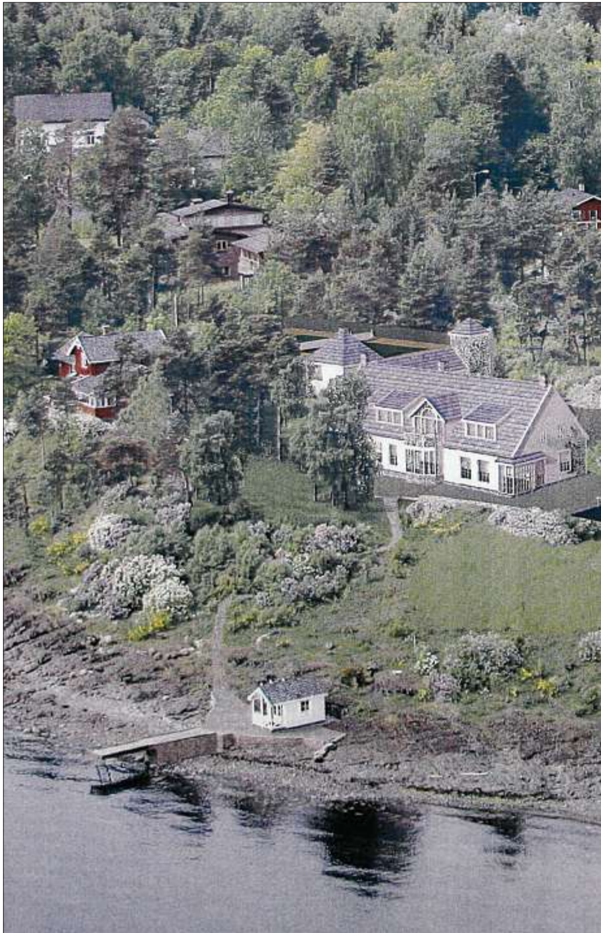
MER TILPASSET: De nye tegningene av Røkkes bolig ligger nærmere byggestilen på Konglungen. Det nye hovedhuset